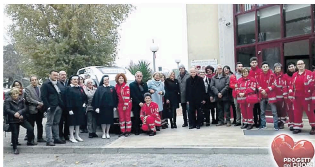
La foto di gruppo nel giorno della donazione del mezzo alla Cri

quattro anni, durante i quali il servizio sarà garantito e gestito in maniera integrale: dall'allestimento del mezzo per il trasporto disabili, alla gestione delle spese (come ad esempio l'assicurazione compresa di copertura kasko). Quest'anno a ricevere il mezzo è stata la Croce Rossa, che ha a disposizione un Fiat Doblò attrezzato per il trasporto